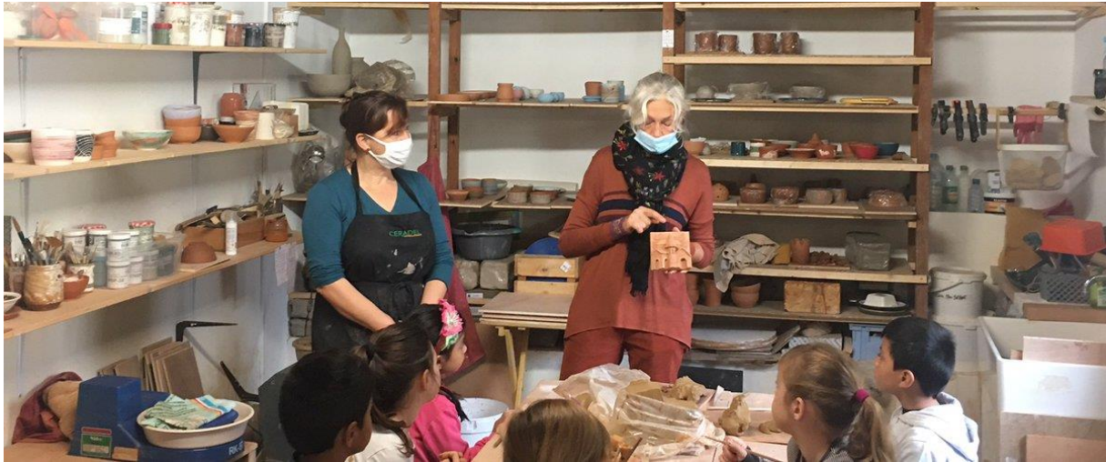
Action « Ma Ville Magique »