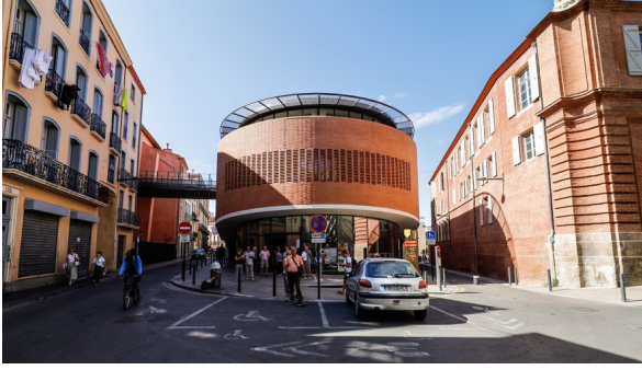
Campus Mailly, Université en cœur de ville