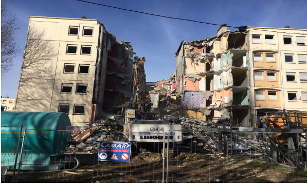
Démolitions Logements Locatifs sociaux à Diaz