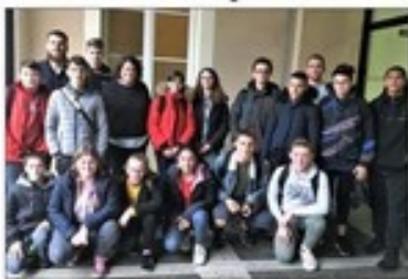
Les élèves avec leurs parrains à Péligny, Fort de Paris.

Le matin de leur sortie, les élèves ont été accueillis par leurs parrains et ont participé à un tour de table où ils ont pu poser leurs questions et échanger avec leurs parrains. L'après-midi, ils ont visité l'ENIAS et ont pu assister à une conférence donnée par un ingénieur de l'entreprise.