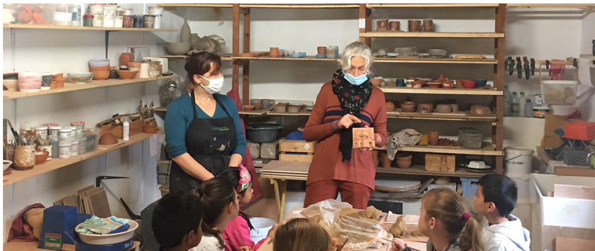
Action « Ma Ville Magique »