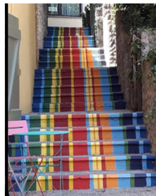
Action du « Pinceau au Clavier »