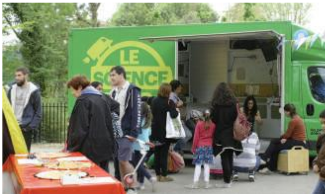
Exemple de l'action des Petits Débrouillards.