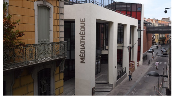
Médiathèque en cœur de ville