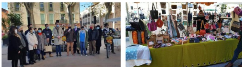
Marché Place de Belgique, Perpignan