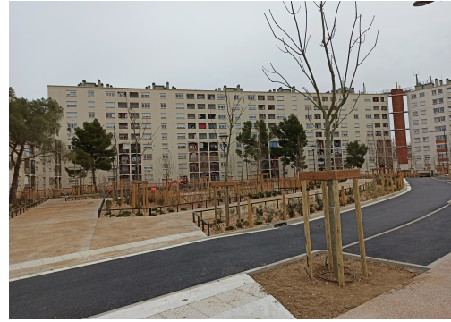
Champs de mars Aménagements extérieurs et jardins partagés (1 er tranche)