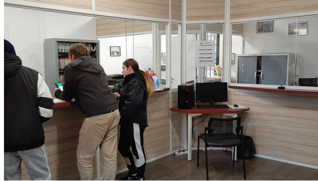
Maison France Services de Banyuls sur Mer