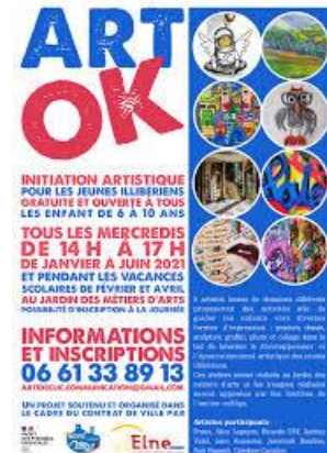
Affiche com' de l'action « ART'OK »