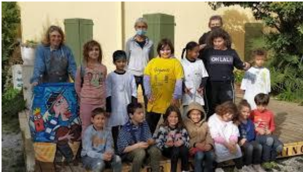
Les enfants entourés des artistes du Jardin des Métiers d'Art