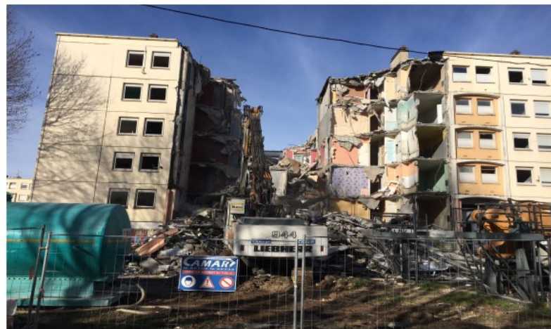
Démolitions Logements Locatifs sociaux à Diaz