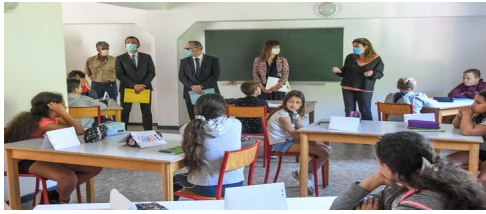
Visite « colo apprenante » de Mosset