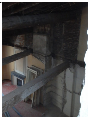
Réhabilitation lourde + travaux énergétiques pour un propriétaire occupant modeste Avant et après travaux