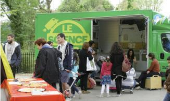
Exemple de l'action des Petits Débrouillards.