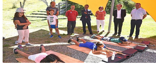
Visite « colo apprenante » d'Err / Puigmal