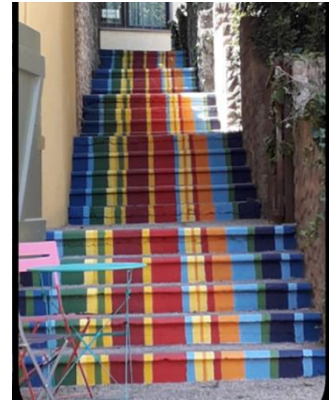
Action du « Pinceau au Clavier »