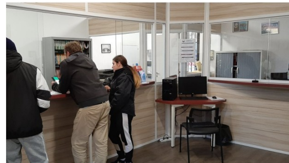
Maisons France Services