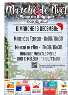
Marché Place de Belgique, Perpignan